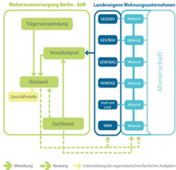
Eckart Güldenber, Forum für Politik und Kultur e.V.